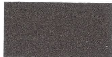
X852 BRONZO CHIARO