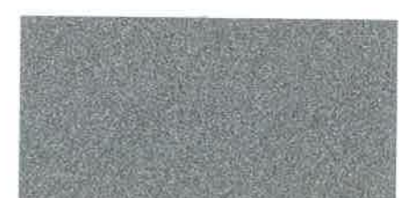
X290 ARGENTO CHIARO