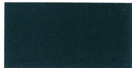
X284 GRIGIO VERDE