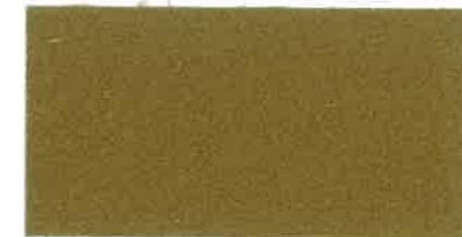
X350 GIALLO DORATO