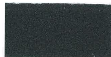
X283 GRIGIO SCURO