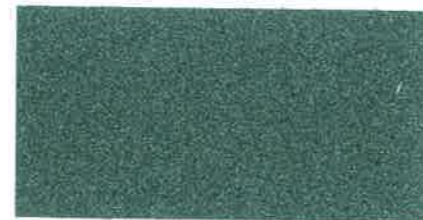
X780 VERDE CHIARO