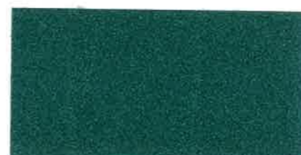
X781 VERDE MENTA