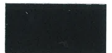
X285 NERO ANTICO