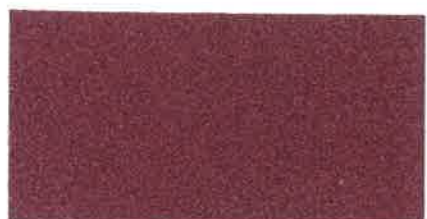
X515 ROSSO GRANATA