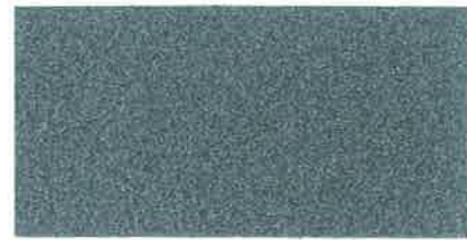
X681 GRIGIO AZZURRO