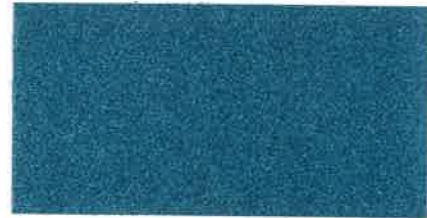
X690 BLU EGEO